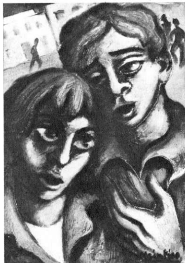
Singende Seuntjies, 1947