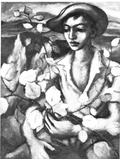
Seun in Herfslanskap, 1952