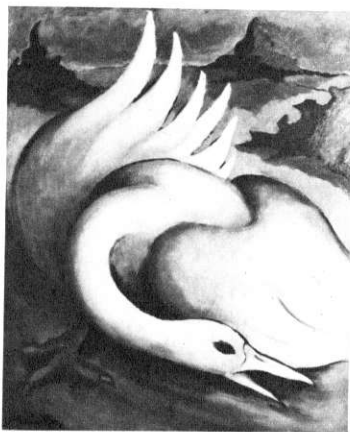
Voël, 1954 (Aangekoop deur die Stadsraad van Pretoria)