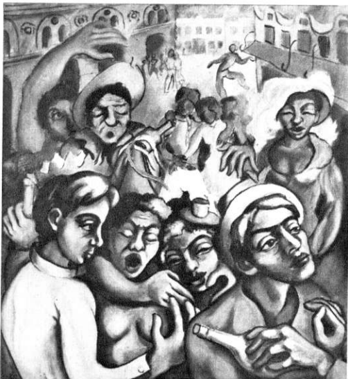
Nagtelike Jolyt, 1948

„Meintjes seems to be concerned not only with the moment of reality, but the preparation before it, and the