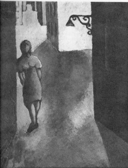
Vrou op Straat, 1957