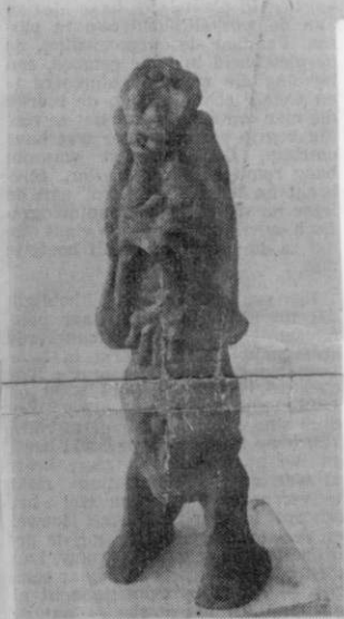
Beeldhouwwerk terra cotta « Mother ».