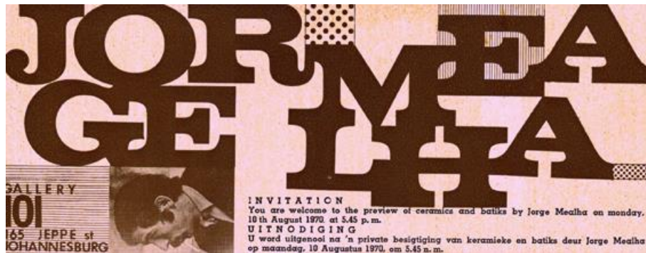
Gallery 101 Johannesburg – exhibition of ceramics and batiks – 10 th August, 1970