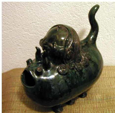
Ceramic from 1970 – 20x12x21 cm