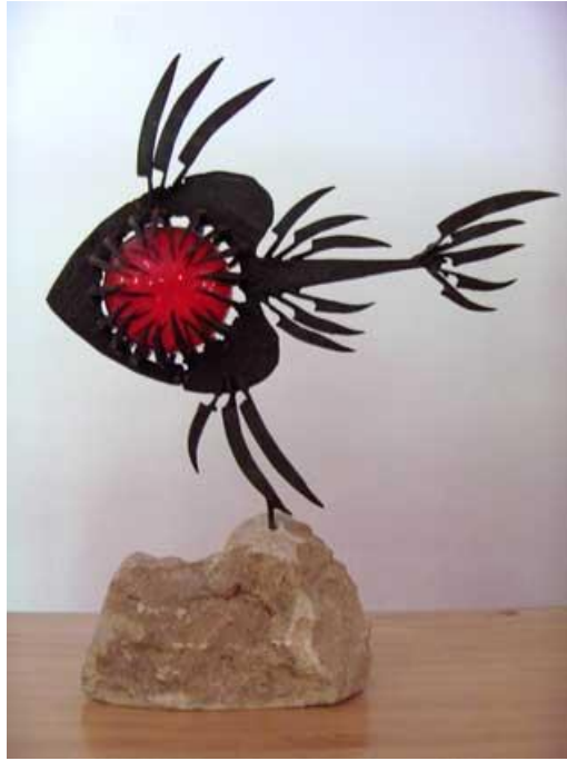
"Fish eye" ("Peixholho"), 1972 – wrought iron and glass on stone sculpture – 66x55 cm incl. base

Exhibited at Núcleo de Arte, Lourenço Marques, 1972, cat. 34